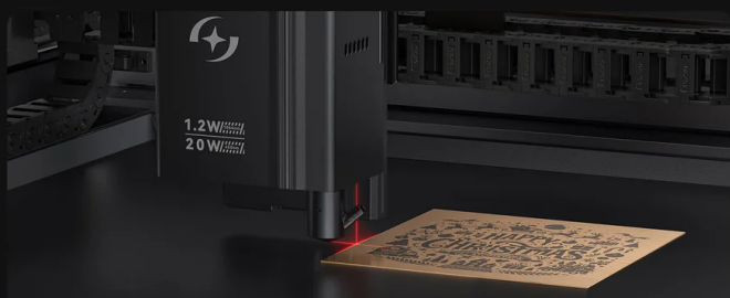
Red Light Cross-Positioning