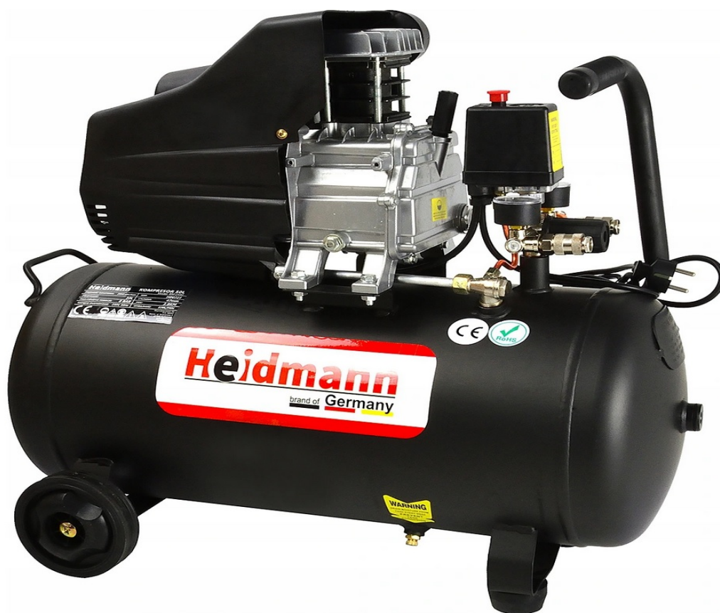
OLEJOVÝ KOMPRESOR KOMPRESOR 50L 8bar HEIDMANN H00721

Jeden z nejvýkonnějších 50litrových kompresorů dostupných na trhu!